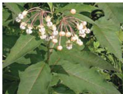
Poke Milkweed Asclepias exaltata Áreas boscosas (excepto en NE, KS, MO, ND y SD).