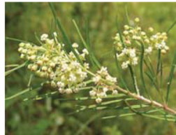
Whorled Milkweed Asclepias verticillata Praderas y áreas abiertas.