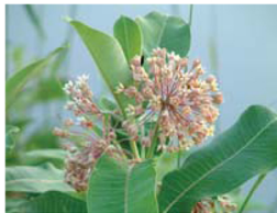
Algodoncillo Asclepias syriaca Suelos bien drenados.