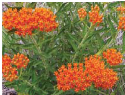
Butterfly Weed Asclepias tuberosa Suelos bien drenados.