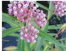
Swamp Milkweed Asclepias incarnata Áreas húmedas, pantanosas.